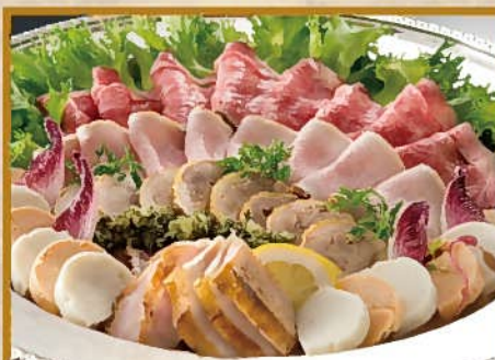
オードブル盛り合わせ(小) 6~8人前 5,000円