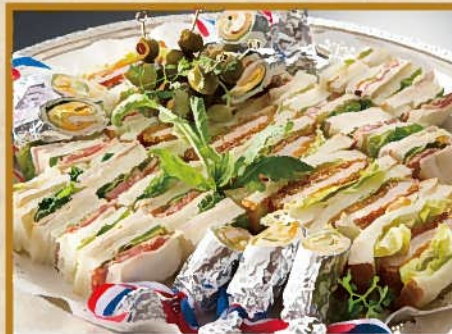
サンドウィッチ盛り合わせ 10人前 5,000円