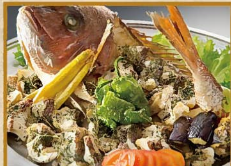
玄海鯛の香草パン粉姿焼き 10人前 7,000円