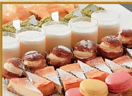
おすすめケーキ盛り合わせ 20人前 5,000円