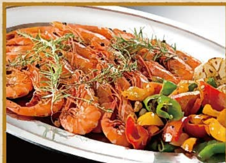
天使の海老ガーリック焼き 10人前 5,000円