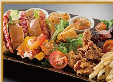
お子様プラッター 3人前 3,000円