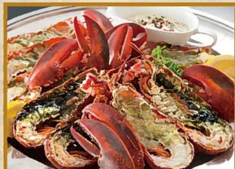
オマール海老のパブール 10人前 10,000円