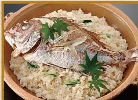
玄海鯛めし 10~15人前〈器:直径39cm〉 5,000円