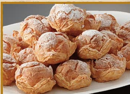
パリパリシュークリーム盛り合わせ 18個 5,000円