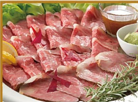
佐賀牛ローストビーフ 10人前 10,000円