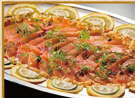
自家製マリネサーモンのカルパッチョ 8人前 5,000円