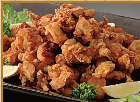
若鶏の唐揚げ 6~8人前 3,000円