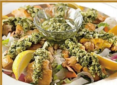
若鶏のロースト ソース サルサベルデ 10人前 5,000円