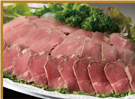
熟成ローストビーフ 8人前 3,000円