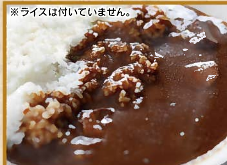
※ライスは付いていません。 ホテルオリジナルカレーソース 8人前 5,000円