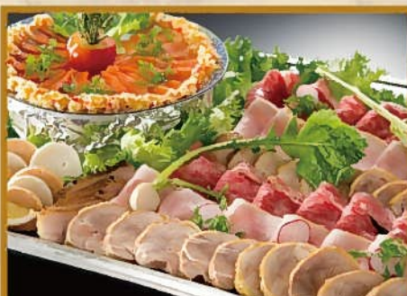
オードブル盛り合わせ(大) 10~15人前 15,000円