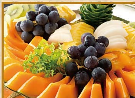
フルーツ盛り合わせ 10人前 5,000円