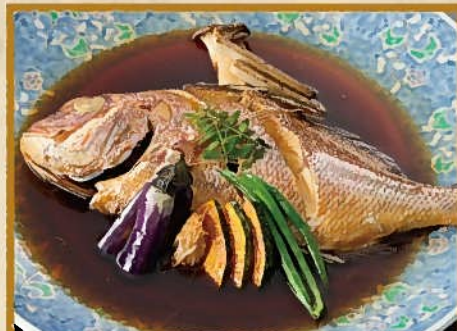
玄海鯛の煮付け 7~8人前〈器:直径40cm〉 5,000円