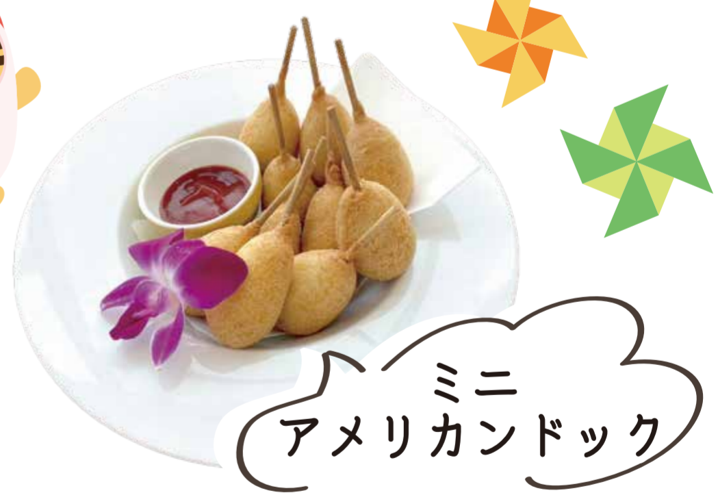
ミニ アメリカンドック