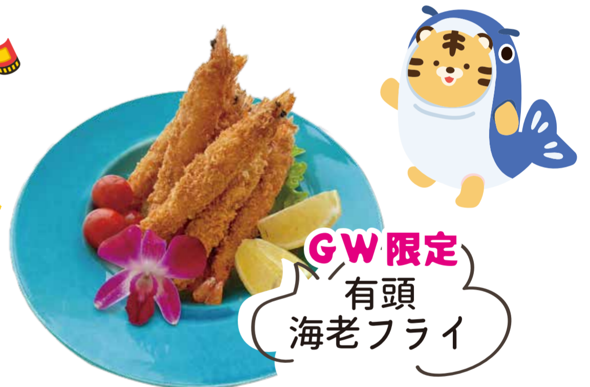
GW限定 有頭 海老フライ